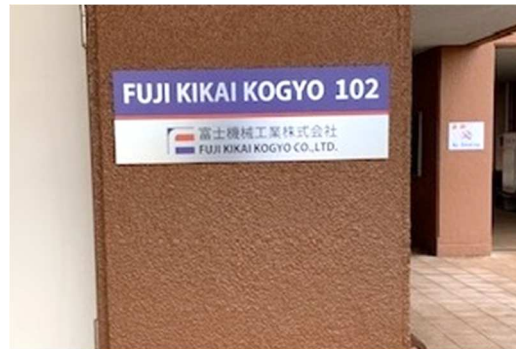
「FUJI KIKAI KOGYO 102」出入口前サイン